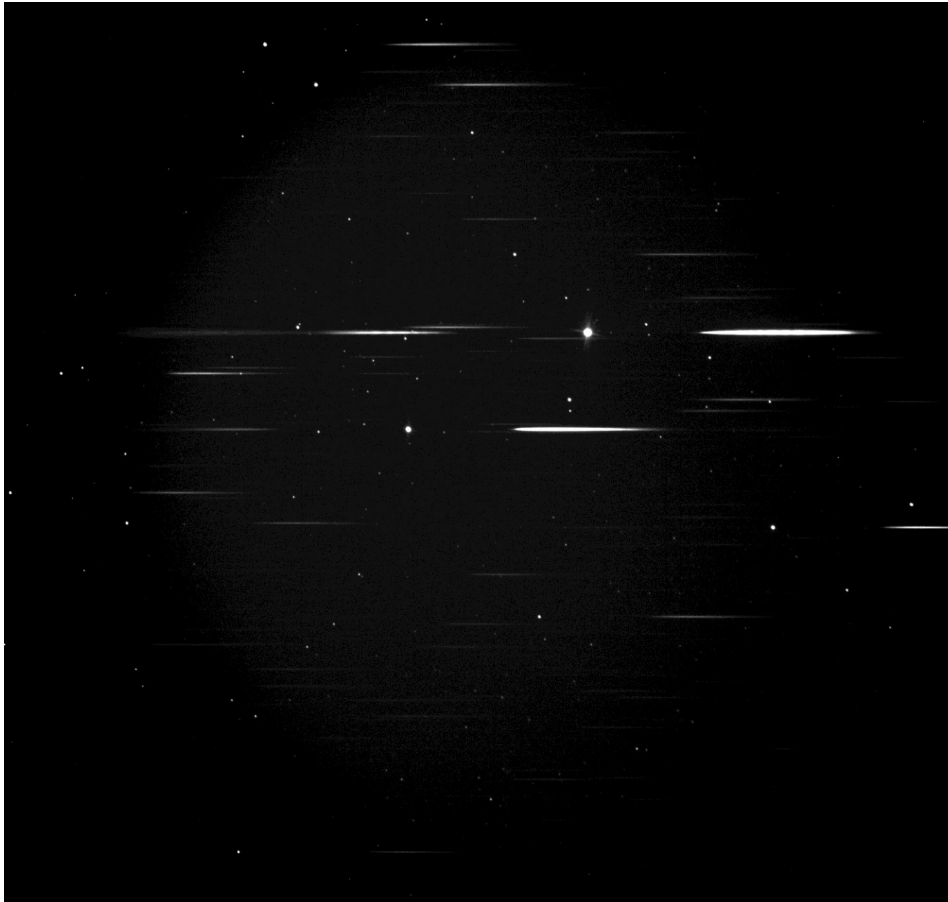
GSC 5992:4439 (= SAO 174298) in Puppis Mag. 6.16 is de helderste ster in de afbeelding. Rechts ervan het spectrum van de +1ste orde (blazed kant), links het spectrum van de -1 ste orde.